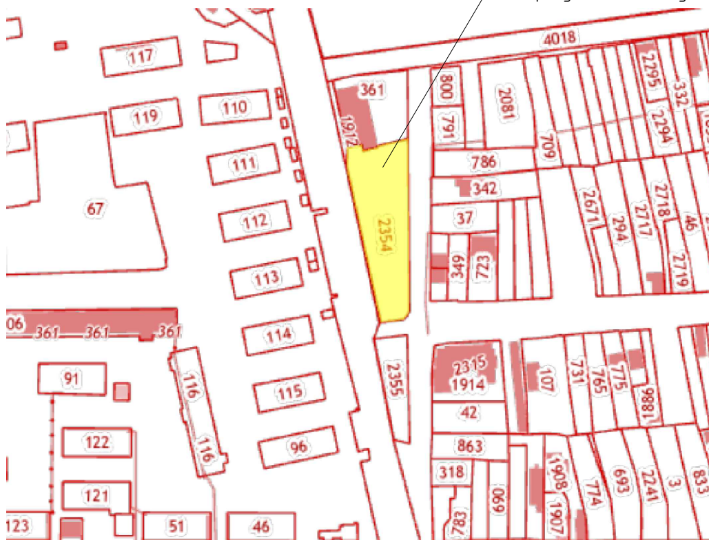
участок с кадастровым номером 61:46:0011703:2354 по адресу: г. Батайск, ул. Кудышева, 171